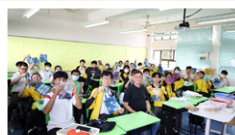
同學展示扎染成果