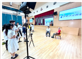
東江縱隊成員正接受訪問

透過這次的採訪，讓我們了解到這支軍隊在抗戰方面發揮了關鍵作用。其勇敢和奉獻精神，象徵著那個時代無數抗戰英雄的共同追求，一切的努力只為民族而奮鬥，只為保家衛國。東江縱隊歷史不能被遺忘，我們必須把這段歷史傳承下去，並向後代傳遞堅韌不拔的民族精神。