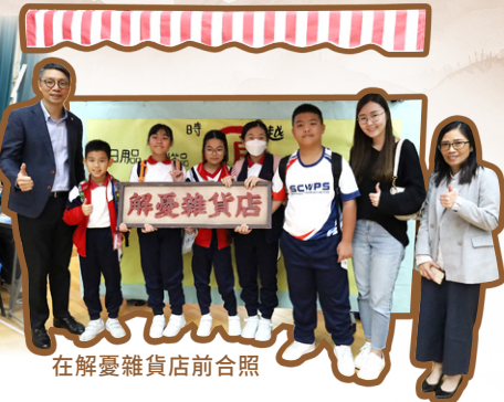
在解憂雜貨店前合照

本校圖書館聯同輔導組今年以《解憂雜貨店》為主題舉行一系列閱讀活動。學生輔導員與老師們群策群力，把本校Café FT佈置成書中場景，在午息期間邀請學生到來把自己的煩憂事放到信箱中，輔導員們更化身店長，分享自己面對煩憂的反思，師生們共享一個忘憂的午後。