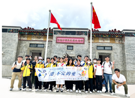
參觀沙頭角抗戰紀念館