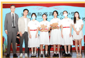
龍校友頒發獎項與師弟妹

的本份，懷著堅韌不拔的鬥志，哪管迎面而來的挑戰和困厄有多艱鉅，都必定迎刃而解，上天也會為你開一扇窗。