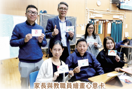
家長與教職員繪畫心意卡