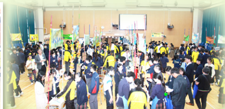
招牌餅乾展銷會萬人空巷