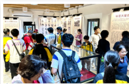
同學參觀館內展品