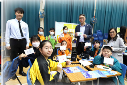
區內小學同學一同參與活動