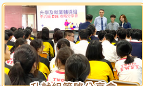
升就組策略分享會