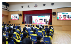
導師介紹川劇變臉藝術