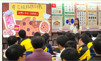
林副校長教授營銷策略及技巧