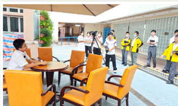
學生學習拍攝技巧宣傳作品