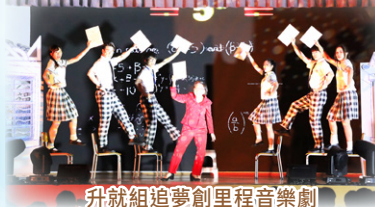
升就組追夢創里程音樂劇