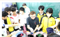
導師傳授扎染技術

總而言之，這兩項活動使我真實的感受到中國傳統技藝的魅力，也讓我因我的祖國而感到自豪。