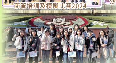
經濟科迪士尼體驗工作坊