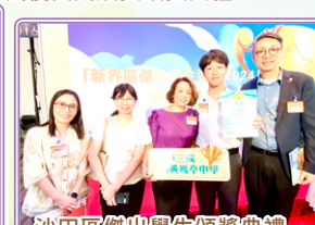
沙田區傑出學生頒獎典禮