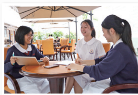
林同學接受編採大使訪問