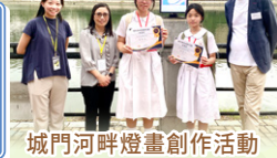
城門河畔燈畫創作活動