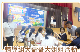
輔導組大哥哥大姐姐活動