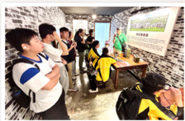
同學體驗抗日戰爭使用的通訊設備