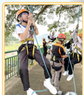
訓育組領袖生訓練營