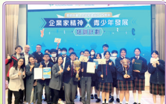
商管培訓及模擬比賽2024