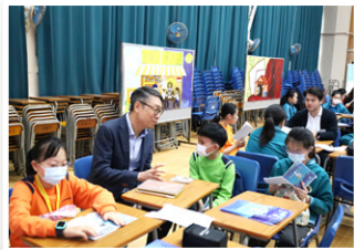
校長與小學同學分享閱讀心得