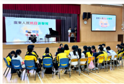
同學靜聽抗日戰爭倖存者的分享