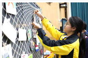
同學將期盼掛在壁報