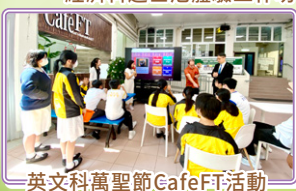
英文科萬聖節CafeFT活動