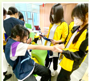
學生參觀明愛照顧者資源及支援中心