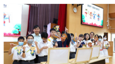
同學展示皮影戲的作品