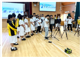
工作人員教授使用燈光、音響器材