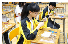
同學製作皮影戲成品