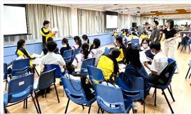
同學正在學習採訪技巧