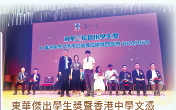
東華傑出學生獎暨香港中學文憑 考試優異成績頒獎典禮