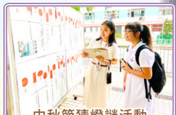
中秋節猜燈謎活動