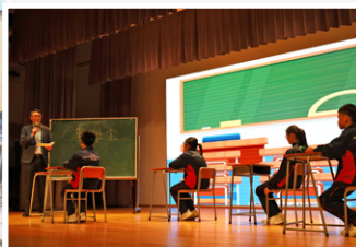
解憂互動劇場——校長粉墨登場