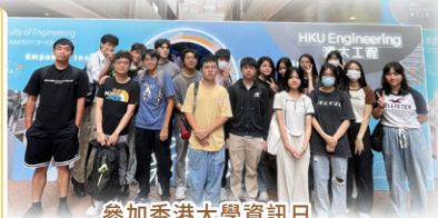
參加香港大學資訊日