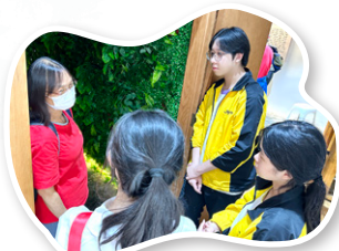
同學與倖存者交流

只有生於戰爭時代的人們才知這兩個看似無足輕重的字有多麼珍貴。在世界上時至今，沒有經歷過戰爭的國家少之又少。中國是一個飽經戰亂欺凌的國家，而我們享受的和平，是先輩先烈拼上無數的血汗與身軀換來的。