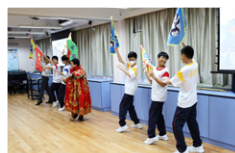
同學體驗川劇藝術