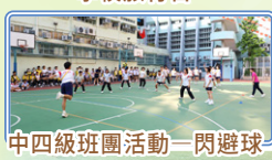
中四級班團活動一閃避球