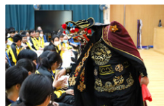
表演者到台下與同學交談