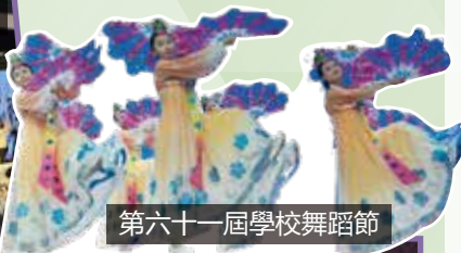
第六十一屆學校舞蹈節