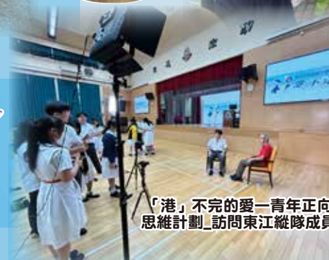
「港」不完的愛—青年正向 思維計劃_訪問東江縱隊成員