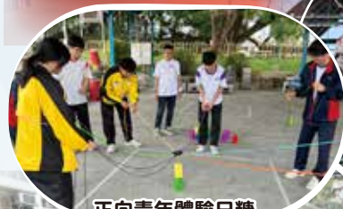
正向青年體驗日糖