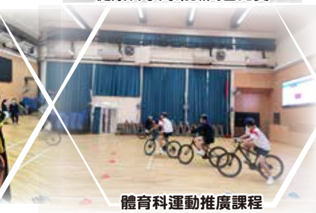
體育科運動推廣課程