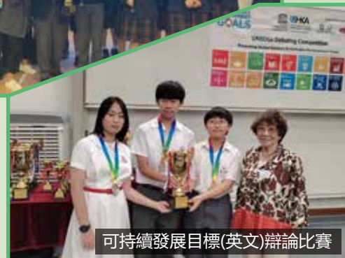
可持續發展目標(英文)辯論比賽