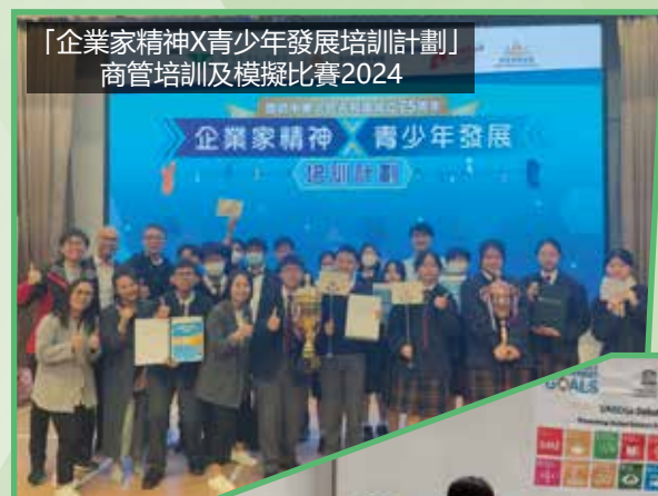
「企業家精神X青少年發展培訓計劃」商管培訓及模擬比賽2024