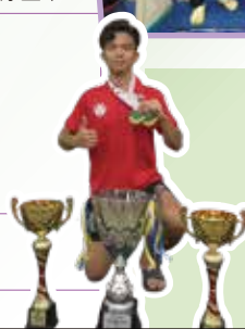
第四十五屆馬來西亞檳城國際龍舟賽