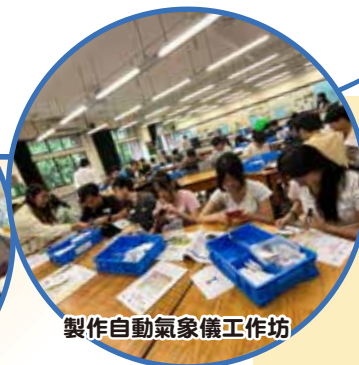
製作自動氣象儀工作坊