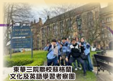
東華三院聯校蘇格蘭文化及英語學習考察團