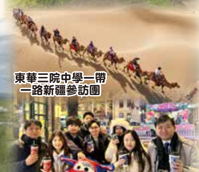
東華三院中學一帶一路新疆參訪團