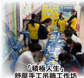
「積極人生」 舒壓手工吊飾工作坊