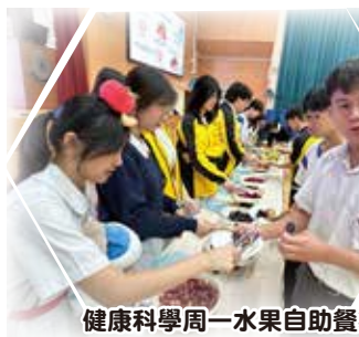
健康科學周一水果自助餐