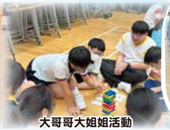
大哥哥大姐姐活動