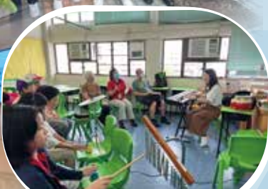
長者學院—音樂體驗班