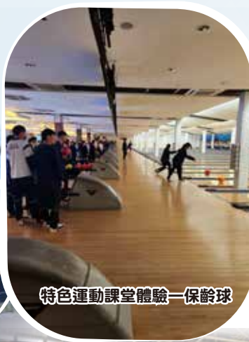
特色運動課堂體驗一保齡球