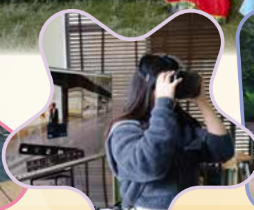
杭州姊妹學校金融科技考察交流