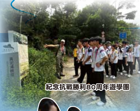
紀念抗戰勝利80周年遊學團