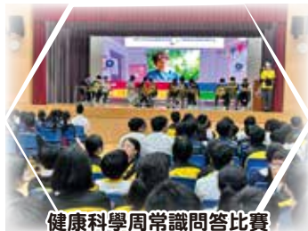
健康科學周常識問答比賽