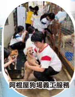
阿棍屋狗場義工服務