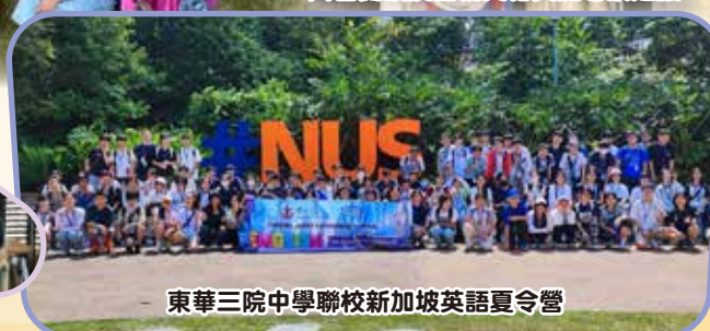
東華三院中學聯校新加坡英語夏令營