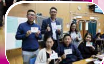
家長參與《解憂雜貨店》閱讀日營