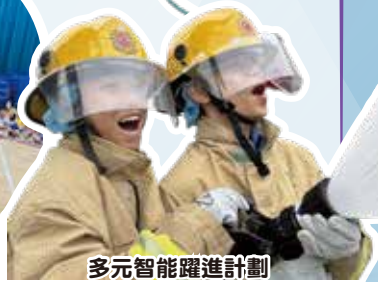
多元智能躍進計劃