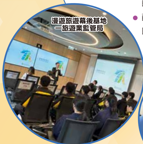
漫遊旅遊幕後基地—旅遊業監管局