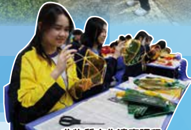
非物質文化遺產課程 —燈籠製作